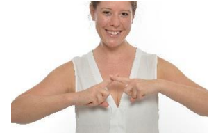
kein tiefer Ausschnitt