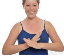
kein Spaghetti T-Shirts