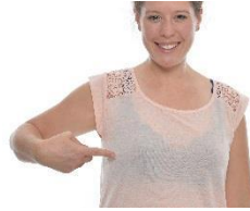
kein sichtbarer BH